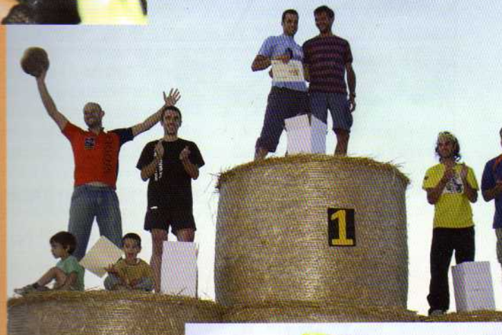
Bona festa del 25è aniversari d'Esplais de la Garrotxa